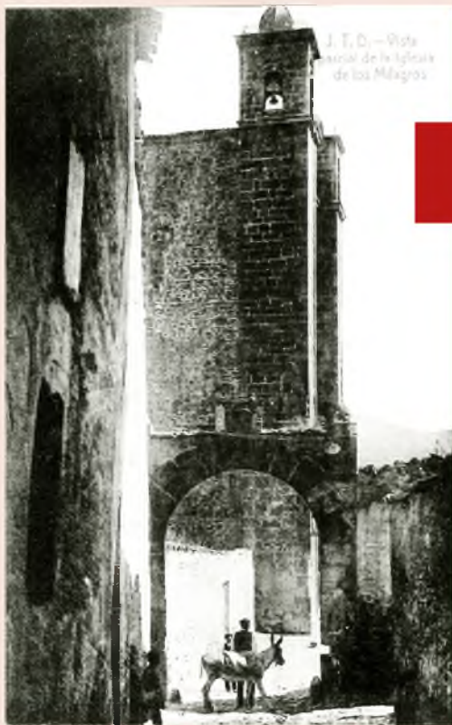
J. T. D. — Vista parcial de la Iglesia de los Mártires