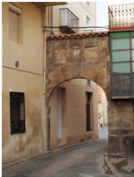
Puerta de Santo Domingo que daba cceso al puente.

Por lo tanto la única incógnita que queda por aclarar, es el lugar donde estuvieron la Sinagoga y el Osario (Cementerio), de este nadie habla, que sin lugar a dudas existió durante el largo tiempo que los judíos permanecieron en Ágreda hasta su expulsión en el año 1492.