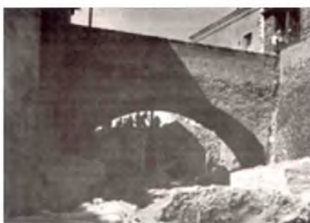
Puente de Santo Domingo, durante las obras de cubrición