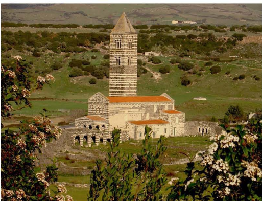
Iglesia de Codrongianos (J.Nuño)

Cámara digital, trípode (opcional) y cable de descarga